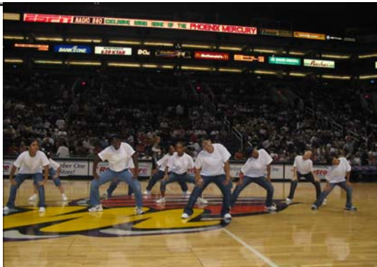
El equipo de Stardust Hip Hop anima al público presentando su baile en el mediotiempo durante el juego de los Phoenix Mercury el Sábado 24 de Julio en el America West Arena.

Saza sonríe cuando se le pregunta cual fue