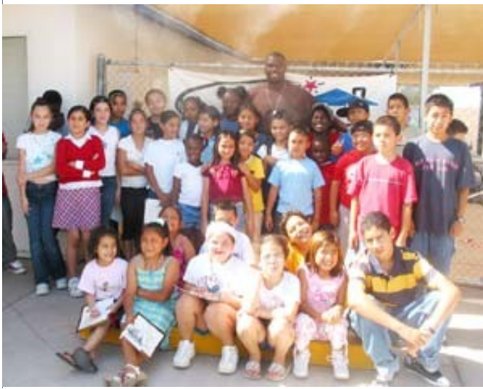
Estudiantes registrados en el Programa de Verano de Stardust posan para una foto con Arizona Cardinal Levar Fisher después de su presentación. Levar compartió una plática inspirada en su lucha por llegar a entrar al NFL.