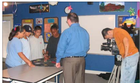
El equipo de Stardust Toy Challenge muestra el juego al camarógrafo de Univision para un segmento de programa de noticias.