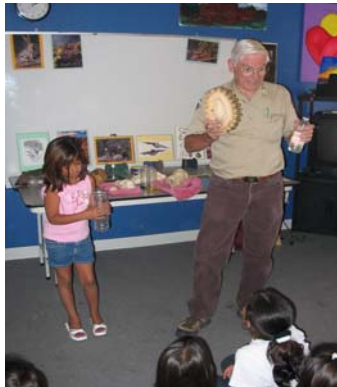
Un representante de ADAPT les enseña a los niños como sobrevivir en el desierto.