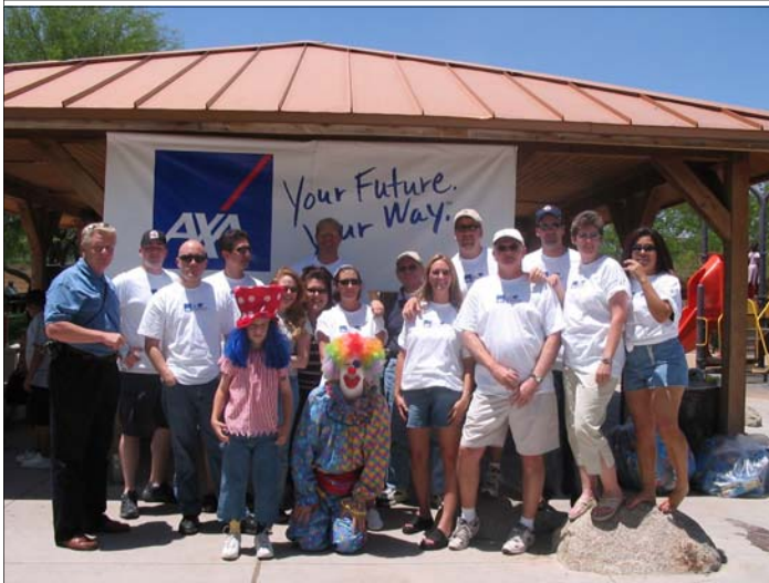
AXA Advisors LLC seleccionaron al Stardust House como organización local para asociarse en un proyecto de servicio a la comunidad. Alrededor de 20 empleados voluntarios coordinaron y planearon el festival. Un enorme agradecimiento a AXA Advisors LLC por un estupendo y divertido evento!